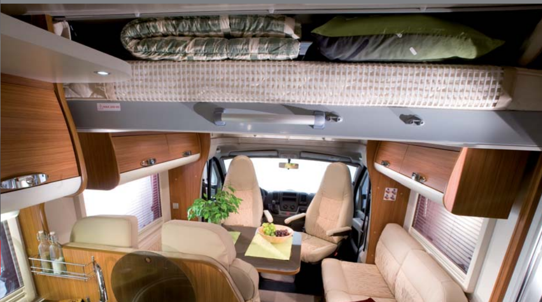
1 Hoogte tijdens het rijden / Hauteur en roulage

In hoogte verstelbaar hefbed / Lit escamatable