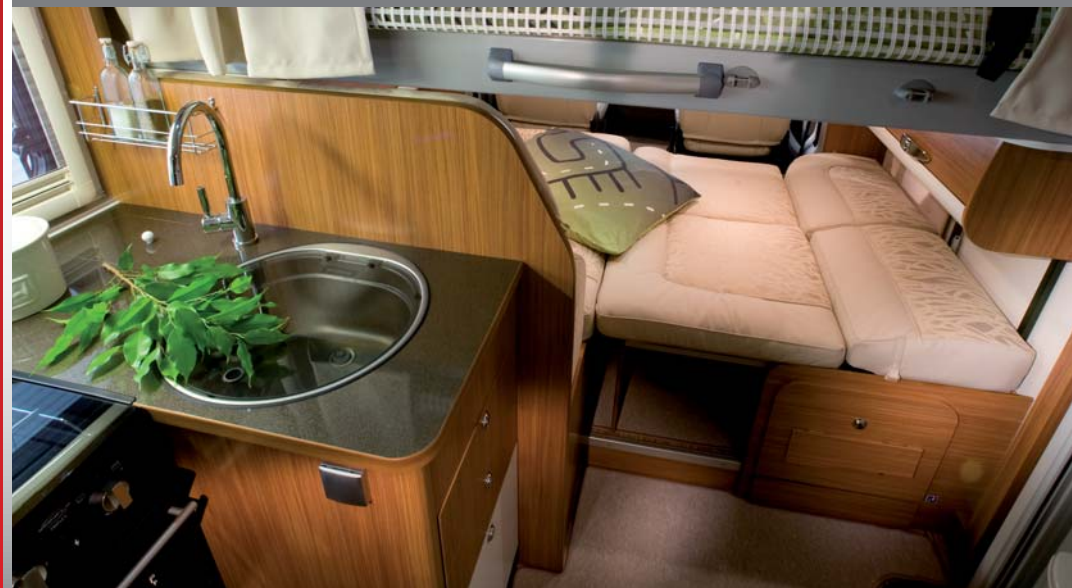
-1 Dinette bed / Lit dinette