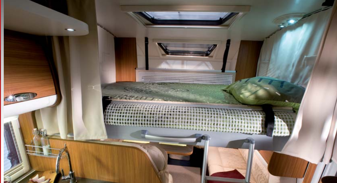
0 Slaaphoogte / Hauteur de couchage

In hoogte verstelbaar hefbed / Lit escamatable