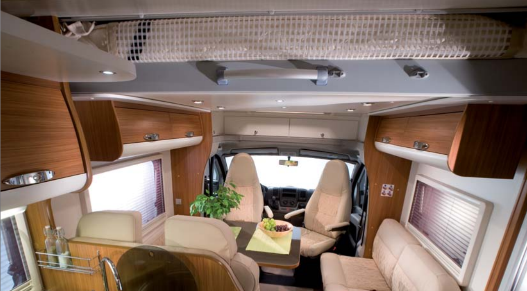
2 Hoogte tijdens het "wonen" / Hauteur habitable